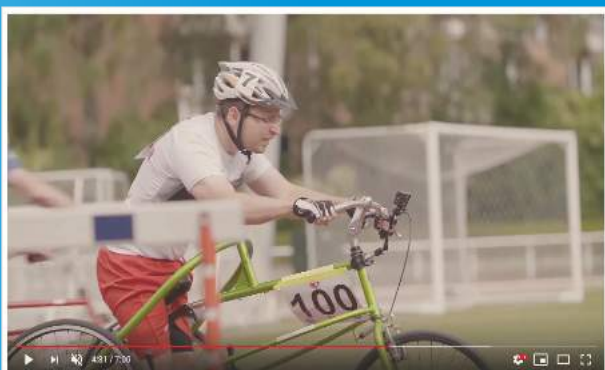
„ROWER” film Fundacji Złotowianka FULL HD, napisy angielskie

https://www.youtube.com/watch?v=TAKXHb1313w&app=desktop Znajdziesz go też, wpisując „ROWER film Fundacji Złotowianka” w YouTube